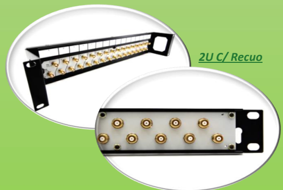
2U C/ Recuo