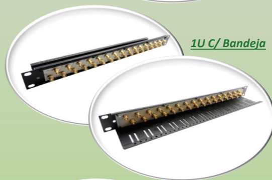
1U C/ Bandeja