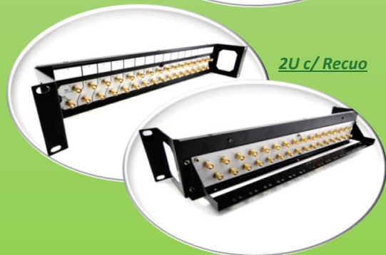
2U c/ Recuo