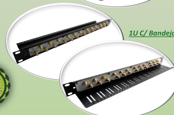
1U C/ Bandeja