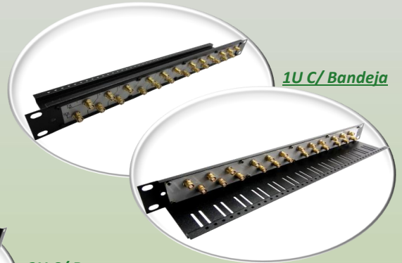
1U C/ Bandeja