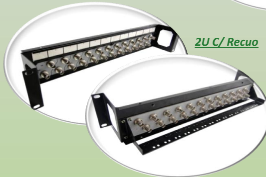
2U C/ Recuo