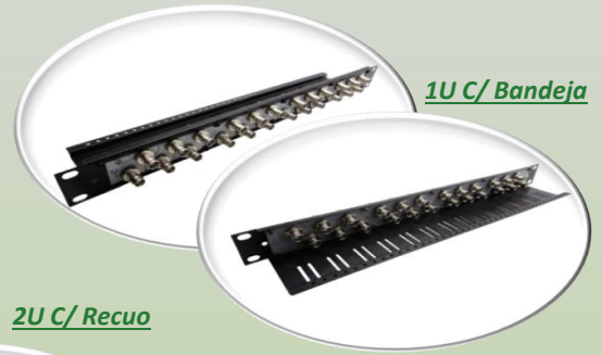
1U C/ Bandeja